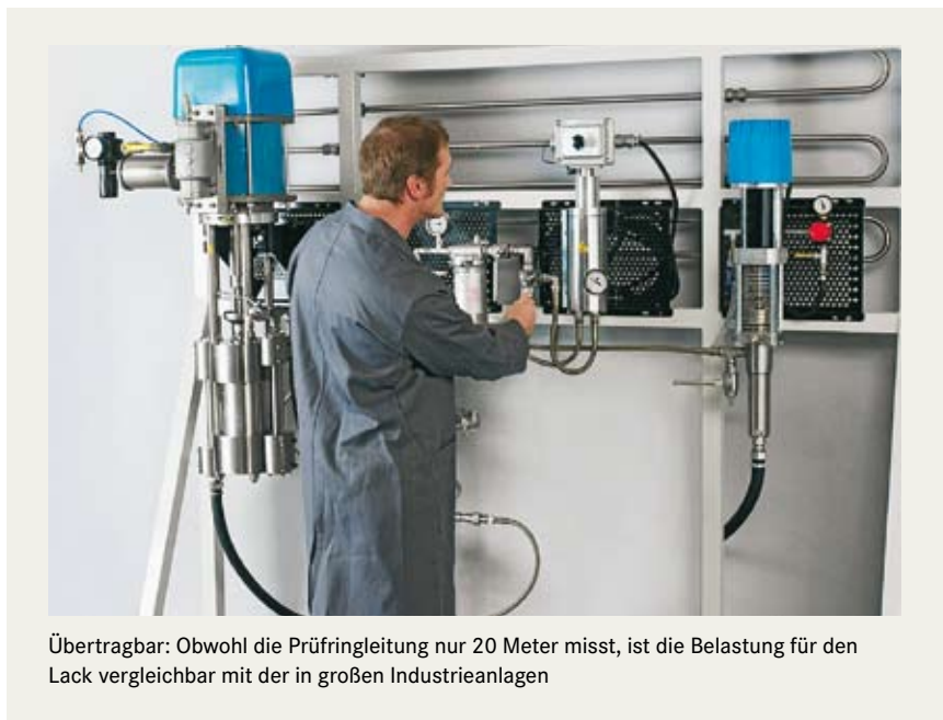
Übertragbar: Obwohl die Prüfringleitung nur 20 Meter misst, ist die Belastung für den Lack vergleichbar mit der in großen Industrieanlagen

Während der Belastung wird online Temperatur, Druck, Fließgeschwindigkeit und Scherrate an unterschiedlichen Stellen gemessen und dokumentiert. So könnten zum Beispiel auch Viskositätsveränderungen infolge einer neuen Lackcharge oder durch zu langes Umpumpen in der Ringleitung direkt gemessen werden. Der Betrieb der Prüfringleitung ist sowohl im Niederdruck- als auch im Hochdruckbereich möglich.